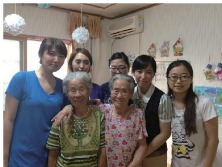
요양병원 목욕 봉사1