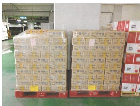
코로나 19 의료진 지원