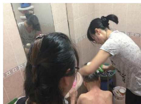
요양병원 목욕 봉사3