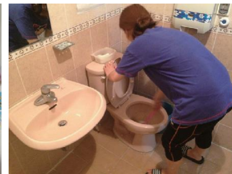
요양병원 목욕 봉사2