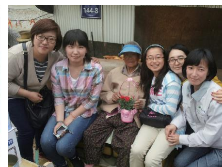
어버이날 독거노인 방문